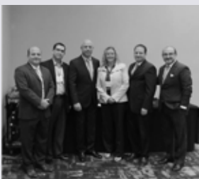
Reunión de AOLM - 2016