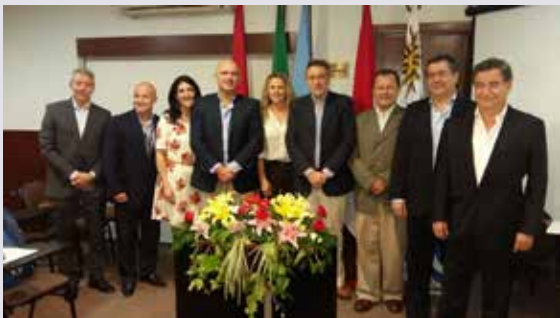
Reunión de AOLM y ALALOG en Bolivia 2015