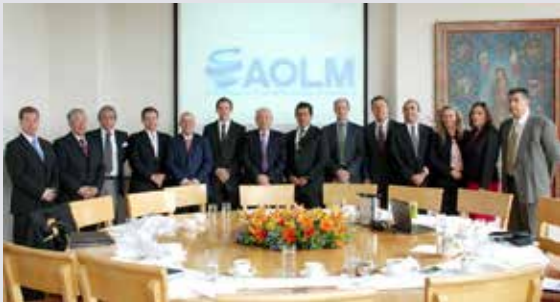
Constitución de la AOLM - 2014

Hace 10 años se constituyó la AOLM, bajo la necesidad de contar con un organismo dedicado a la representación de los Operadores Logísticos. Fue la asesora Miebach Consulting, quién, de la mano de los socios fundadores llevaron adelante este proyecto que hoy es sólido y referente en la industria logística.