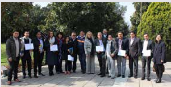
Reunión de Grupos de Trabajo y Comités - 2017